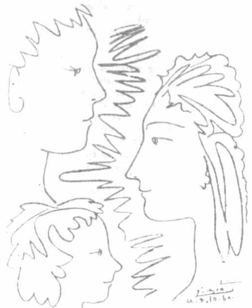
PABLO PICASSO RAJZA (1960)

A keresztény egyházban a húsvét utáni 50. nap. A Szentlélek eljövételének, majd az Egyház megalapításának ünnepe.