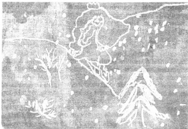
Forrai Lujza 9 éves 1. sz. Ált. Iskola