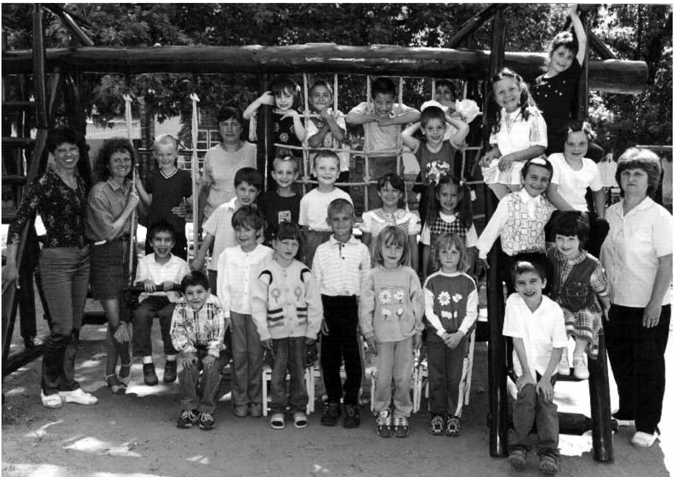
Negyvennyolcas utcai Óvoda