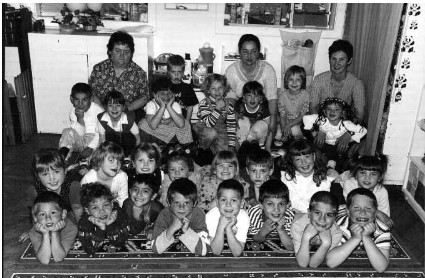
Széksósi úti Óvoda (1.)