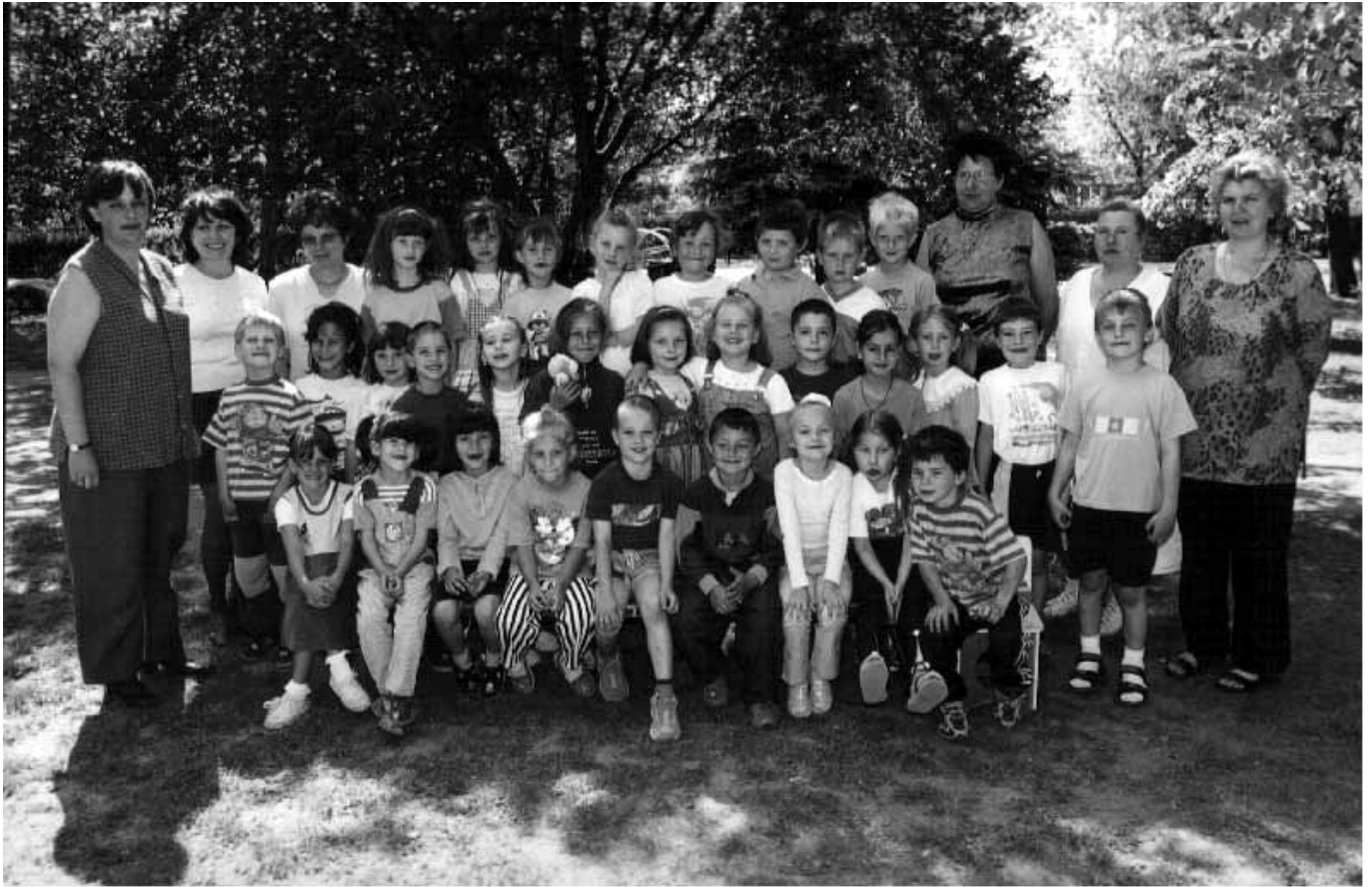
Jerney utcai Óvoda