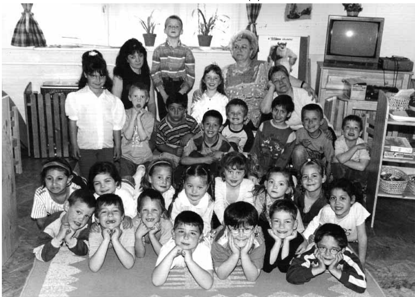
Széksósi úti Óvoda (2.)