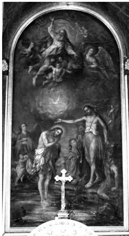
A dorozsmai templom főoltárképe, amelyen Keresztelő Szent János megkereszteli Jézust.

János az Isten szándéka szerint az új kezdésre, a bűn zsákutcájából visszatérésre hívogató ember, aki a reményt erősíti kortársaiban. Istennek odaadott remete életével, szavaival és kezével is rámutat a rég várt Messiásra, aki mindannyiunk számára az Út, az Igazság és az Élet. Jézus egész életével együtt jelzi, hogy az emberi történelem nem a bűnhődésre, nem a halálra, hanem inkább a megújulásra, az újjászületésre van ítélve.