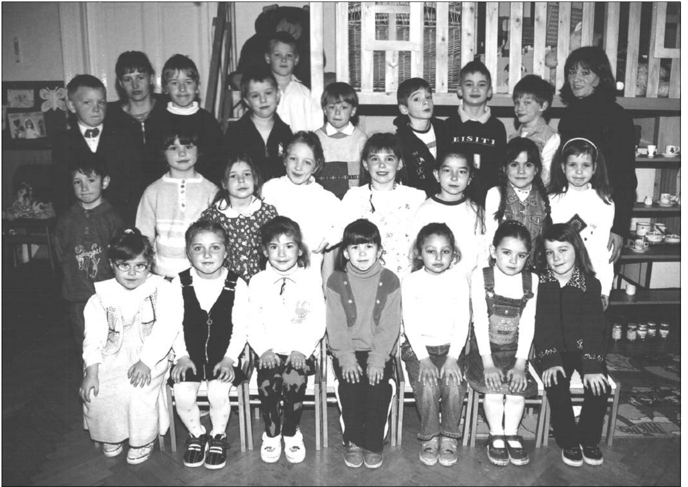
A Negyvennyolcas utcai óvoda ballagó csoportjai