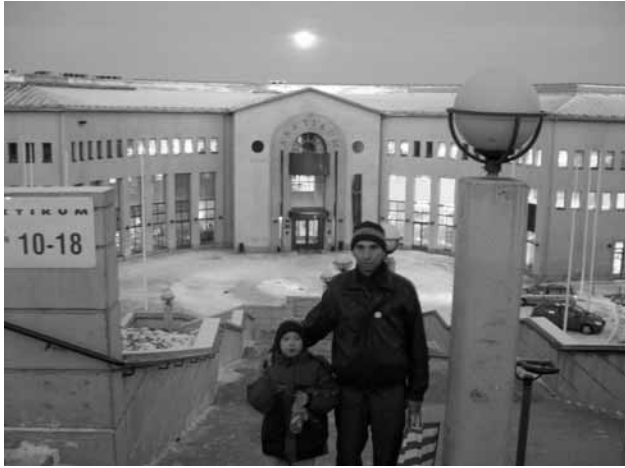
Az Arktikum bejárata előtt

Róma, Amszterdam, stb. Kerestem Budapestet, de sajnos nem találtam.