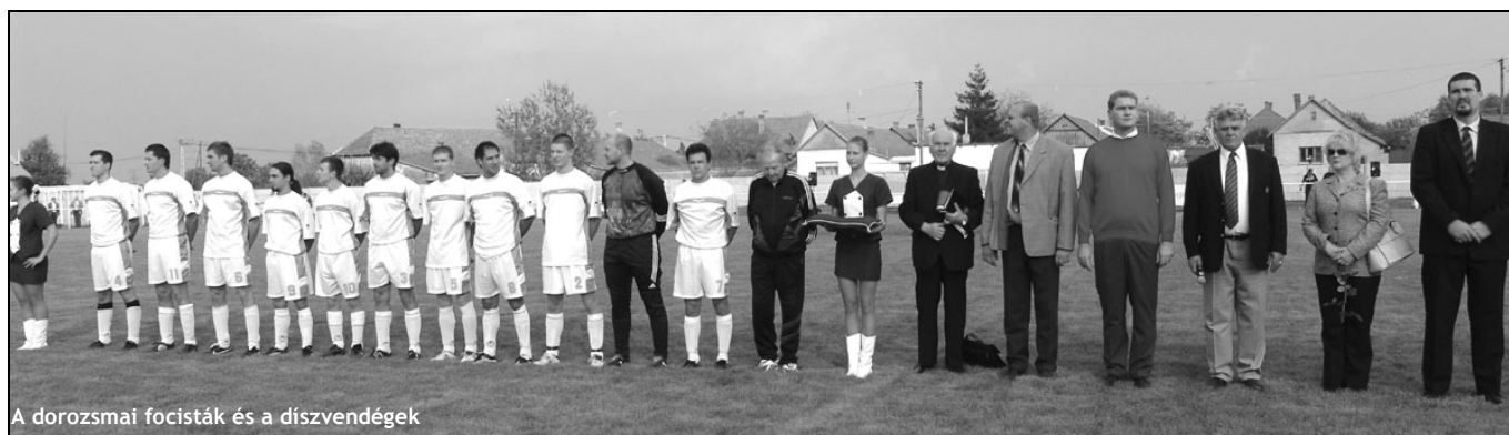
A dorozsmai focisták és a díszvendégek