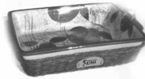
Kacsasütő tál UNI emblémával

Vásároljon Purina tápot és gyűjtse a zsákon lévő címkéket értékes ajándékokért.