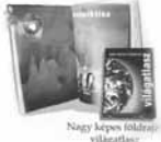
Nagy képes földrajzi világatlasz

Ajándékaink: bögre, sütőtál, takaró, világatlasz, szobanövény-lexikon. A részletekről érdeklődjön az üzletben.