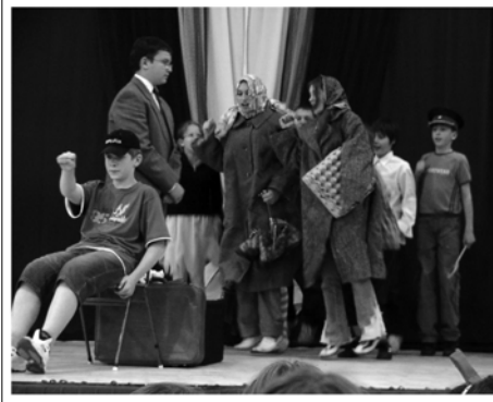
2006. május 12. Diákönkormányzat napja