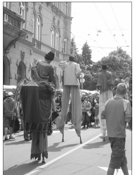
Gólyalás művészet szórakoztatják a néződöket a május 20-21-én megrendezett hídi vásáron.