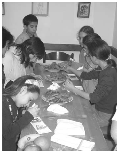
Mézeskalácsot is díszíthettek a gyerekek.