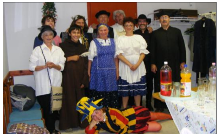
A DOROZSMAI VERSMONDÓK KÖRÉNEK CSAPATA.