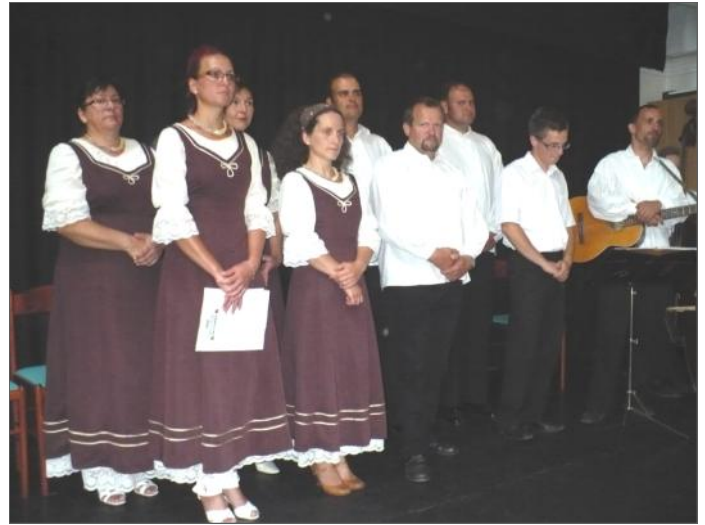
A CSÓLYOSPÁLOSI TAMBURÁS EGYÜTTES.

A környező települések is szívügyüknek tekintik a rendezvény célját. Csólyospálos és Zsombó küldöttsége polgármestereik vezetésével tisztelték meg a kiállítást, magukkal hozva községük, közösségük üdvözlését, tájleltő finomságaikkal, ételleikkel, italaikkal látva vendégül a jelenlévőket. Mindezt zenével-dallal fűszerez-