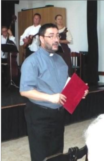
KONDÉ ATYA MEGNYITÓ BESZÉDET MONDOTT.

Környezet-fotográfiai vándorkiállításnak adott helyet a Művelődési Ház. A július 15-i rendezvényre a Magyar Ökoszociális Fórum Európai Kommunikációs Intézete szervezett képkiallítást. Nagyszerű, egyben elgondolkodtató cél vezérelte a résztvevőket: nem csak hazánk építészeti műremekeit, hegyeit, várait, kastélyait kellene reklámozunk, ne a csodás budapesti panorámát láttassuk folyton, amikor gyönyörű Alföldünk apró falvai is megannyi meglepetést tartogatnak számunkra.