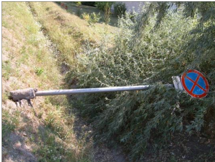
VALAKINEK NAGYON AZ ÚTJÁBAN VOLT A TÁBLA.

Másnap reggel fél hatkor a Jerney utcai óvoda melletti játszótéren időzött egy fiatalokból álló csoport. A közelmúltban földlabdával ültetett fák közül egyet gyökerestül kihúztak. A frissen ültetett fák merevítő léckeretei közül hármat letörték és azokból tüzet rakva melegedtek. A környéken lakók közül volt, aki látta a történetet, mégsem értesítette a rendőrséget.