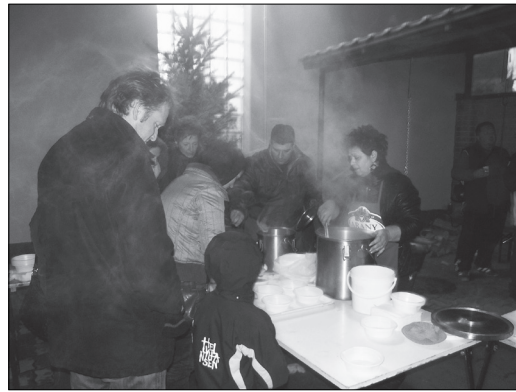
Melegétel várta a melegedni vágyókat