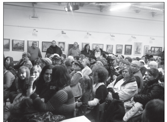
Talpalatnyi hely sem maradt a teremben