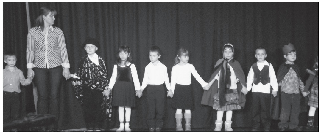
Óvodások és kisiskolások tánca