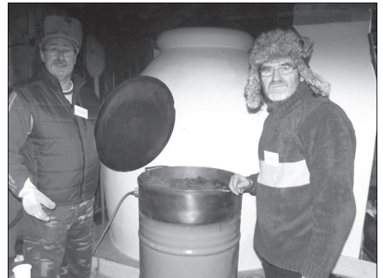
Ezt is jól kisütötték...