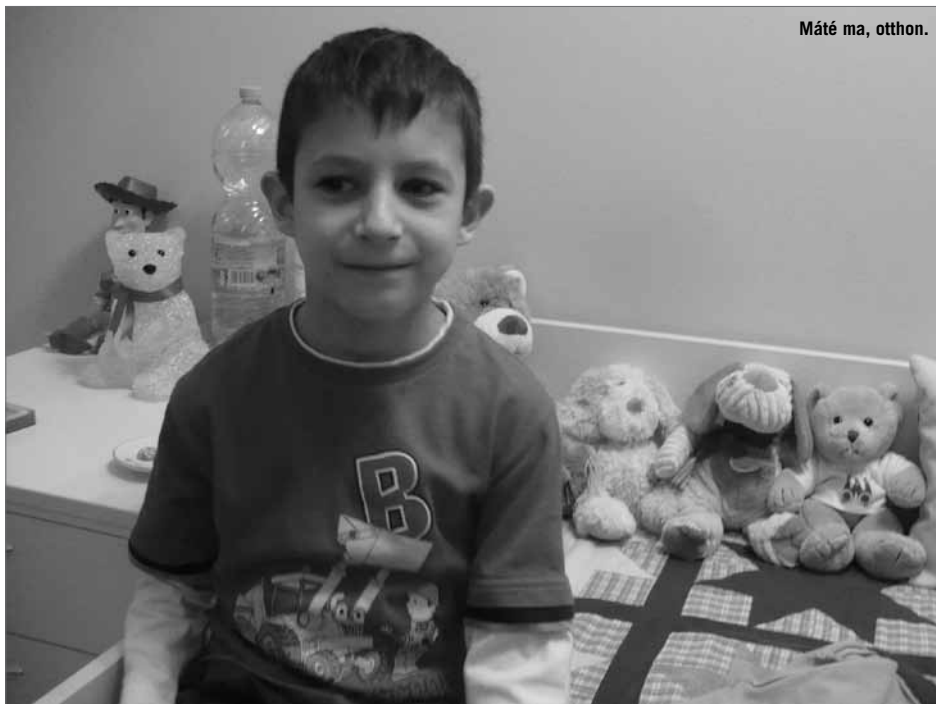
Máté ma, otthon.

milliósi költségét. Ehhez az OEP külön engedélyét és a minisztérium hozzájárulását kellett kiharcolni. A kampánynak köszönhetően 2010. március 19-én a meggyötört kis test működését végre stabilizálni lehetett, a műszív elkezdhetett dolgozni a kisfiú szervezetében. Ablonczy főorvos és a kórházi személyzet óriási munkát végzett, teljes erőbedobással próbálták a család és a kórházi kezelés együttes szerepét felvenni, ellátni.