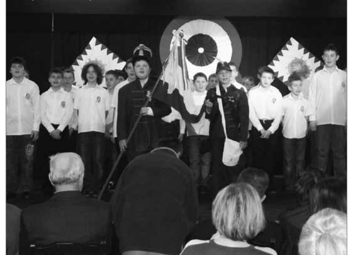
Orczy diákok ünnepi műsora a művelődési házban.