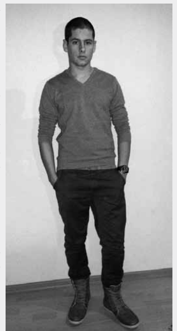
SZERETŐ ÉS AGGÓDÓ BARÁTOK