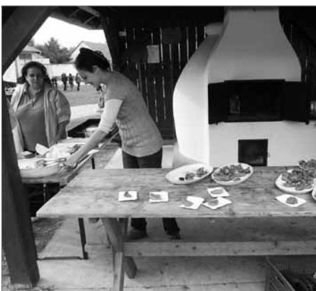
Sülttök is kapható volt.