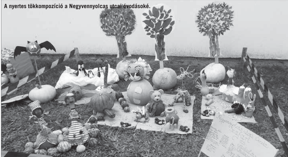
A nyertes tökkompozíció a Negyvennyolcas utcai óvodásoké.