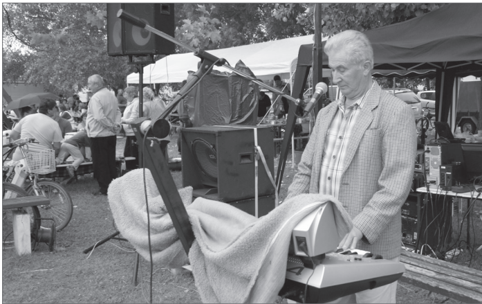
A zenélésnek az eső sem jelentett akadályt.