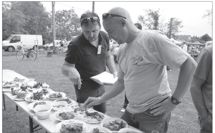
A zsűri tudományosan zsűrizik.