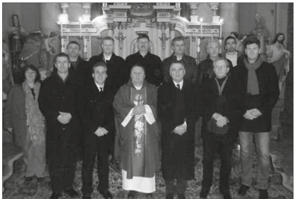
A KISKUNDOROZSMAI EGYHÁZKÖZSÉGI TANÁCS TAGOK