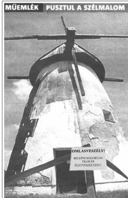
Az elmúlt hetek heves esőzése és az erős szél miatt leomlott a kiskundorozsmai szélmalom egyik oldala. Az 1821-ben épült malom 1971-1974 között építették újjá, 1993-ban nyilvánították múemlékké. Az Alföldön egyedülálló szélmalom az álla- mé, a vályogépület karbantartására azonban az elmúlt időben nem jutott pénz.

„Az Alföldön egyedülálló szélmalom az államé, a vályogépület karbantartására azonban az elmúlt időben nem jutott pénz.” (Metro, 2005. június 17.)