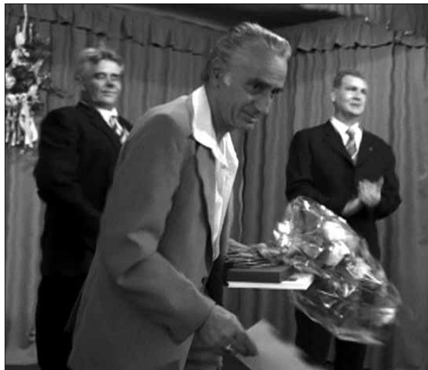
A Dorozsmáért Emlékérmé tulajdonosa

Valóságos mini Tour de France-ot varázsoltak a községbe a kerékpárverseny nevezői. Sajnálatosan a dorozsmai szímalom csak kívülről volt megtekinthető. A Napok harmadik helyszíne a templom volt, az ott történt eseményekről egyházi mellékletünkben tudósítunk.