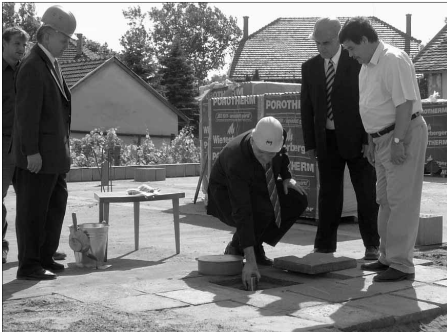
Az alapköletétel pillanata