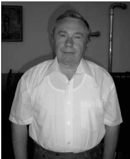
Az év mecénása

A négynapos rendezvénysorozat kulturális és szórakoztató programokat is magában foglalt. A különböző népi együttesek, zenekarok, ipar- és népművészeti programok törzsközségének igényein túlgondolva a szervezők gondoskodtak arról, hogy az egyszerűen csak felüdülésre vágyó és érdeklődő lakosok is megtalálták a maguk időtöltését: a díszteremen koncertezett az Apostol együttes két tagja. Akár utcabál is lehetett volna, tűzijáték nélküli.