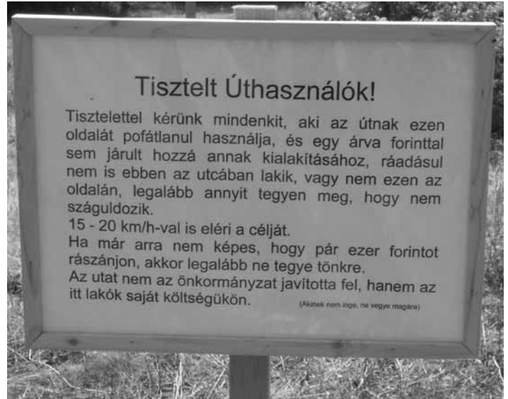
Egy olvasónk lőtte Subasa területén ezt a fényképet. Annyit ír még: „No comment.”